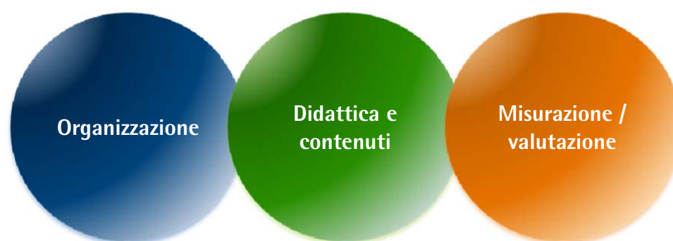
Fig. 1 – Aree di sviluppo del Modello didattico in materia di educazione finanziaria

Il Modello riporta indicazioni orientative in merito ad aspetti amministrativi e organizzativi, approccio didattico e contenuti e, infine, misurazione/valutazione dei risultati (Fig. 1), sintetizzandole in moduli ad hoc denominati UdA (Unità di Apprendimento), per una loro pronta utilizzabilità e trasferibilità nel contesto scolastico (si veda la successiva Sezione 3).