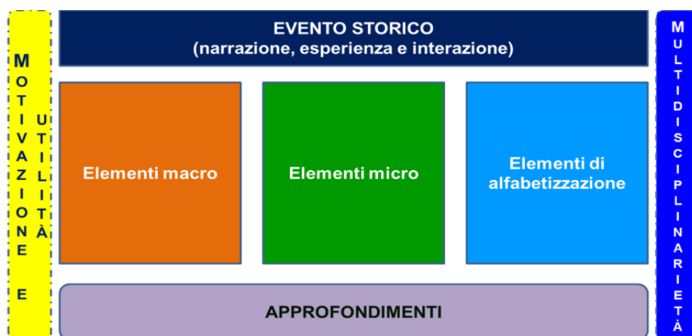
Fig. 3 – La struttura logica dell'intervento formativo

La struttura logica della didattica e dei contenuti del Modello ruota attorno a un evento storico significativo, relativo a una vicenda specifica, che ha interessato il sistema economico-finanziario di uno o più Paesi, e declinabile su tre piani riguardanti, rispettivamente: elementi macro-sistemici, elementi micro-individuali, elementi di alfabetizzazione (nozioni di base; Fig. 3).