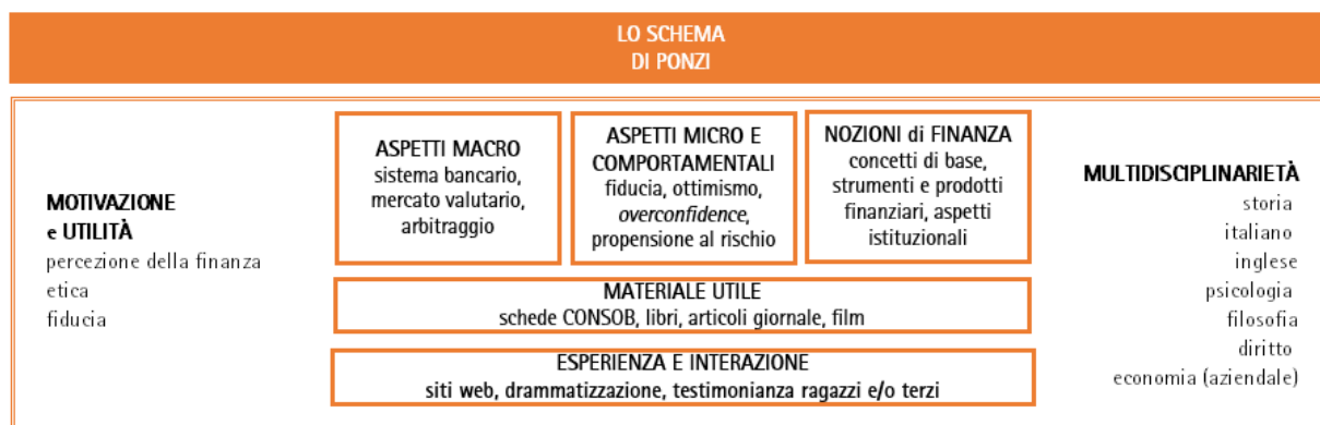
Fig. 5 – La struttura logica del Modello applicata a un caso concreto (schema Ponzi e truffe finanziarie)