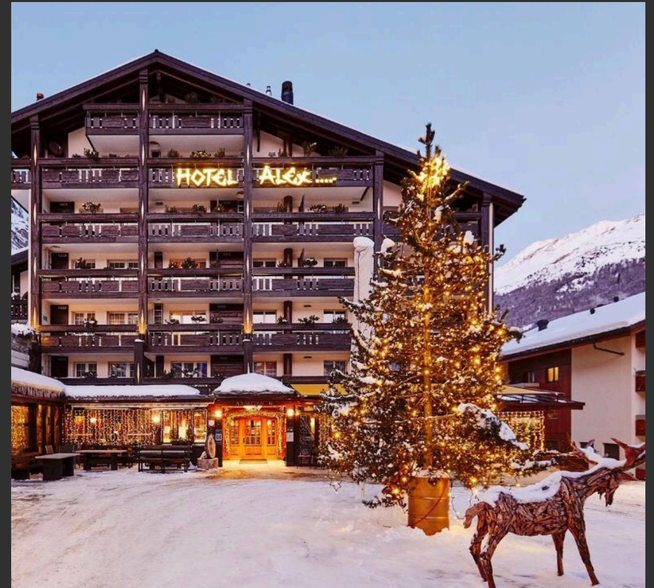
Hotel Alex a Zermatt, il quale ogni anno fornisce vitto e alloggio a escursionisti e sciatori